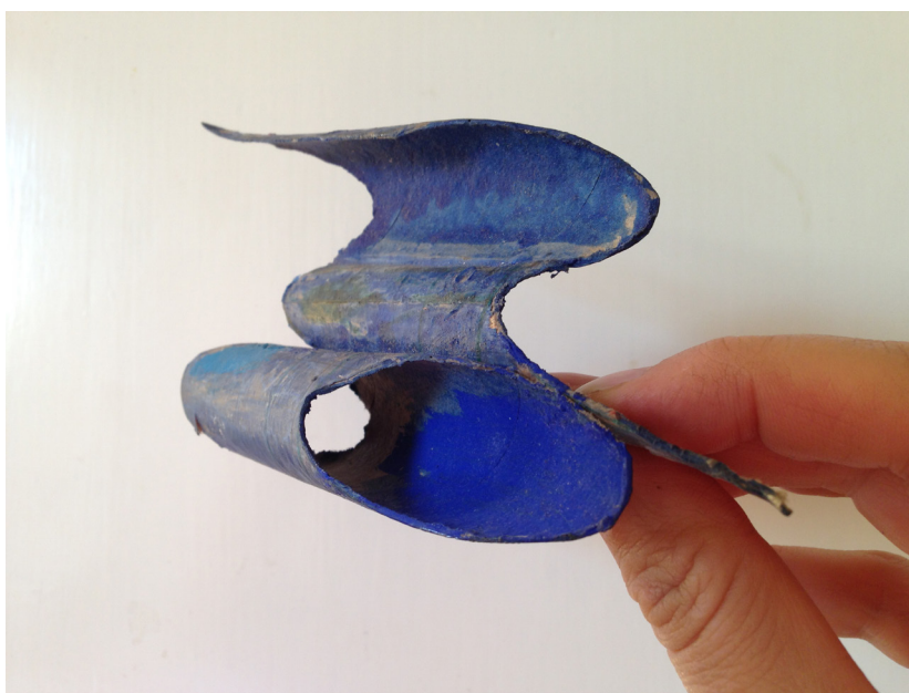
Eline Mugaas, Scale Model #12, 2014. Modell: Siri Aurdal.

Finngatan 2, SE - 223 62 Lund +46 46 222 72 83 skissernasmuseum.se